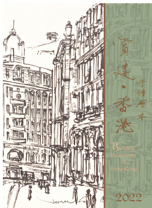
圖為《賞建·香港》手繪曆本 Building the accents of Hong Kong 2022 的封面，設計精美，內容豐富，甫出版便大受歡迎。

藝術家賀煒倫先生去年加入青年文化大使，於此次出版計劃中提供十多年間精心繪畫的一系列香港美景作品，透過歷史書籍和明信片重新繪製香港的歷史建築和風貌，希望透過繪畫和藝術令現代人對於香港的歷史有更深的了解，燃起對建設美好香港的赤誠之心。