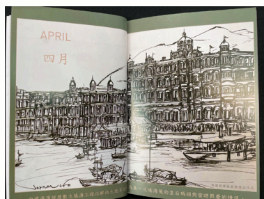
圖為四月份的插圖，介紹皇后碼頭，繪畫了當時節慶的樣貌。

手繪日曆本於每一個月份的日曆表加插一幅古建築圖畫，介紹了許多香港著名古建築，包括一九零五年上環永樂街海旁、一九三零年代位於中環德輔道中的香港廣東銀行、皇后碼頭、嘉諾撒仁愛女修會教堂等，逐一引領觀賞者追尋舊香港蹤跡。